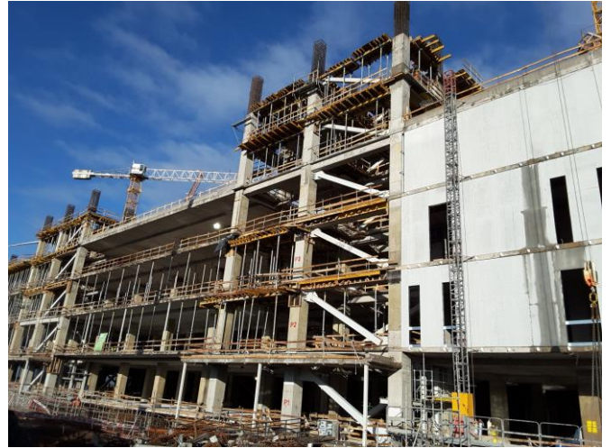
Vista fachada oriente.