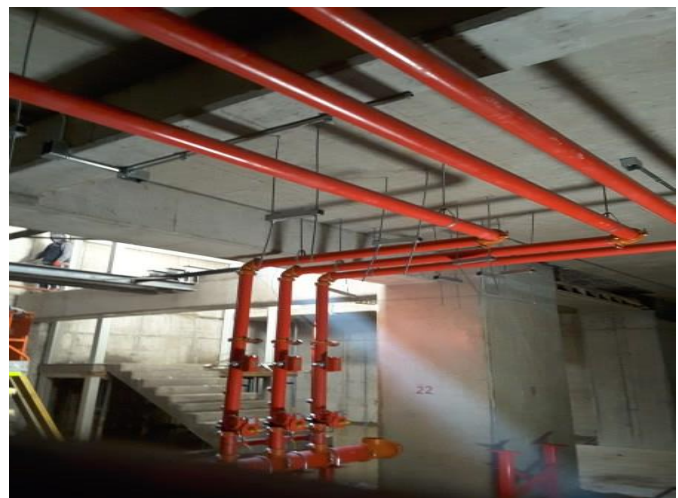
Avance de instalaciones.