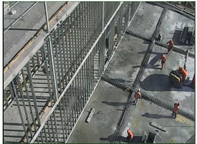
Vista parcial losa piso 5.