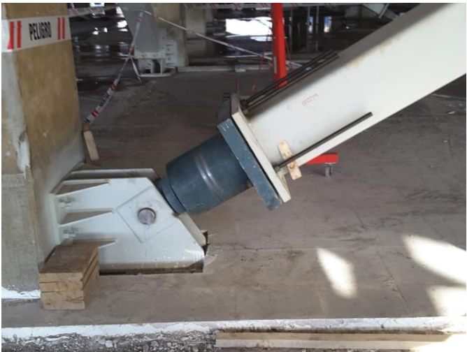
Instalación de Riostras.