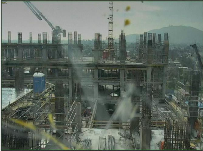
Vista parcial obra gruesa pisos quinto, sexto y séptimo.